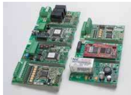
Опциональные платы для дополнительных функций.

Функциональность может быть расширена путем использования опциональ-