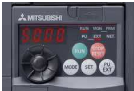
Встроенный поворотный пульт управления

Благодаря встроенному поворотному пулту управления пользователь получает намного более быстрый непосредственный доступ ко всем важнейшим параметрам – по сравнению с традиционными кнопочными системами управления.