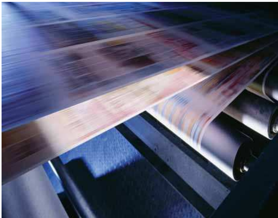
Системы транспортировки бумаги, как в этой типографии, – это всего лишь одна из многих областей применения новых преобразователей частоты серии FR-E700.