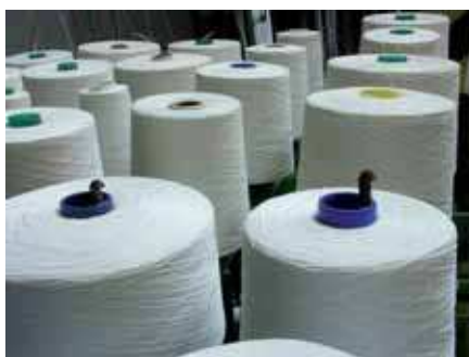
В текстильной промышленности без преобразователей частоты компании Mitsubishi тоже не обойтись.